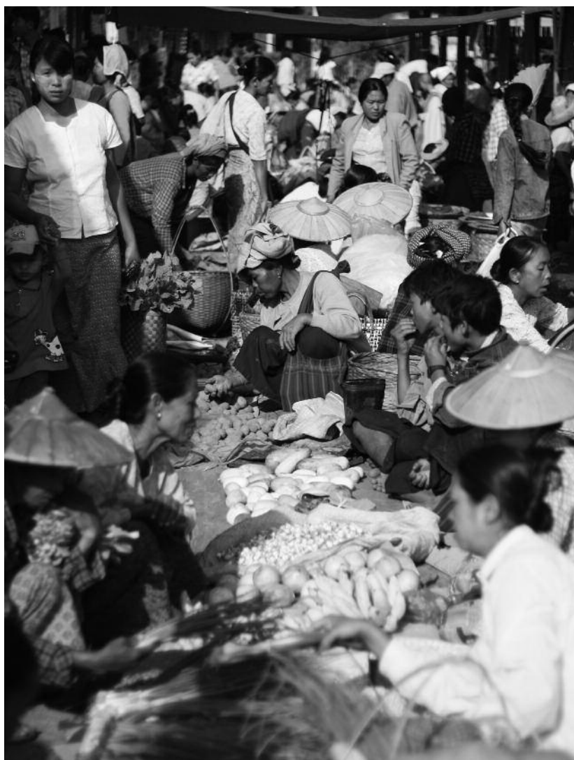
Marché, Birmanie