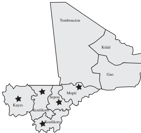
Figure 1. Mali. Localisation des régions enquêtées (*).

Le système de santé est basé sur des structures publiques, privées et communautaires, mais la situation sanitaire de la population reste préoccupante. Le taux de mortalité infantile était de 103,83 pour 1 000 naissances vivantes en 2008, le taux d'accroissement était de 2,7 %, le taux de natalité 49,38 pour 1 000 habitants et le taux de mortalité de 16,16 pour 1 000 habitants. L'espérance de vie à la naissance était de 49,94 ans en 2008 (4).